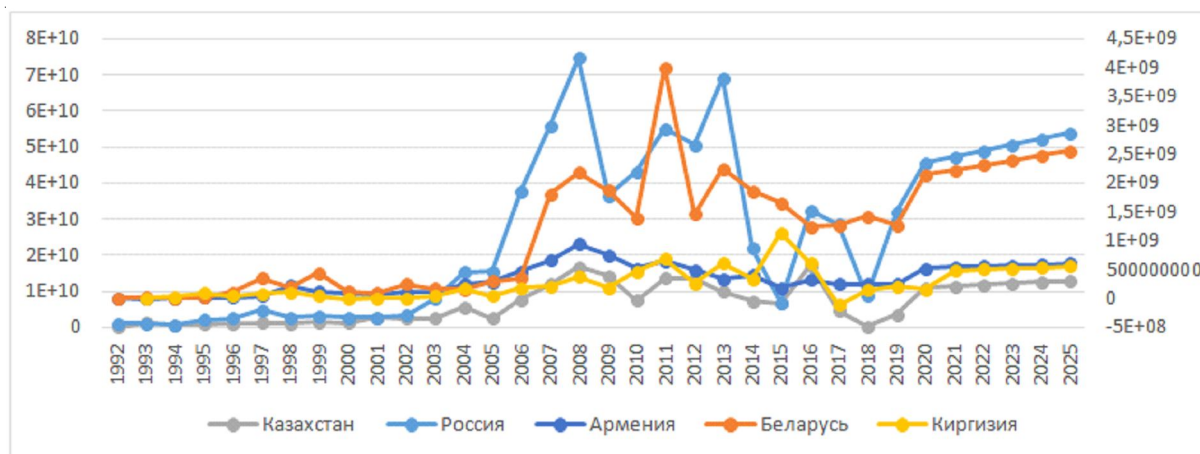
Рис. 3. Приток ПИИ в ЕАЭС [4]

Для ЕАЭС ситуация несколько иная. На сегодняшний день объем ПИИ в ЕАЭС хотя и растет, но медленнее, чем мог бы. Из-за санкций против России европейские компании не могут инвестировать в российские проекты, а Беларусь и Казахстан – два наиболее привлекательных в сфере инвестиций государства ЕАЭС, вынуждены поддерживать российскую политику контрсанкций [11, с. 1396–1414]. Рисунок 3 описывает ситуацию и прогноз инвестиций в ЕАЭС.