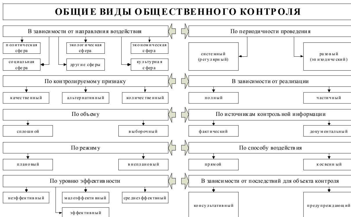
Рис. 1. Общие виды общественного контроля

Некоторые общие виды общественного контроля предложенной классификации требуют пояснения. По контролируемому признаку выделяется качественный, количественный и альтернативный контроль по показателям деятельности органа власти. Например, качественным общественным контролем государственных закупок является соответствие фактического качества товара (работы, услуги) условиям государственного контракта. Аналогичное разъяснение по количественному признаку. Альтернативным контролем является, к примеру, проверка необходимости функционального значения товара (работы, услуги) потребности органа власти. По способу воздействия общественный контроль подразделяется на прямой и косвенный. Прямой общественный контроль предполагает прямое воздействие на орган власти: непосредственное взаимодействие с должностными лицами. Косвенный контроль